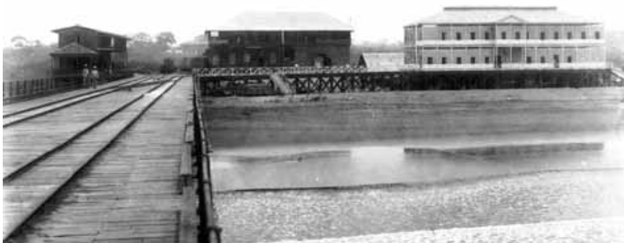
Figura 2. Vista del muelle y aduanas del Puerto de La Libertad, circa 1920.

almacenes, maquinaria, un astillero, una estación para el acuatizaje de hidroaviones, muelles de recreo y las defensas necesarias de la playa del Obispo (Herradora Alcántara, 1927).