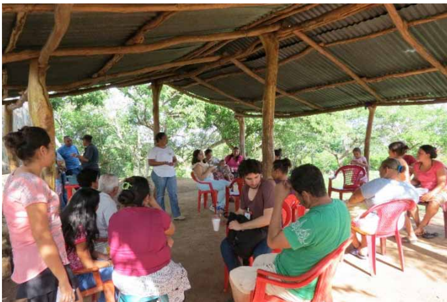
Figura 3. Vista del desarrollo del grupo focal llevado a cabo en la comunidad Los Ángeles, municipio Puerto de La Libertad.