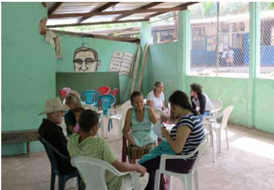
Figura 4. Vista del desarrollo del grupo focal en la comunidad El Charcón, municipio del Puerto de La Libertad.