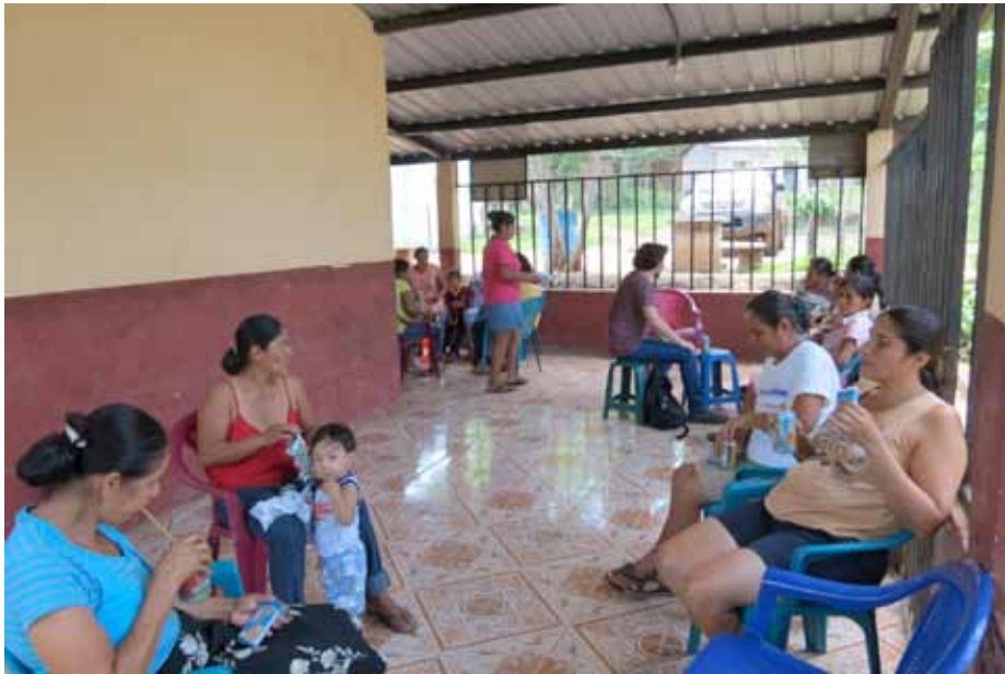
Figura 12. Vista de la realización de los grupos focales en la comunidad Las Mesas, municipio Puerto de La Libertad.