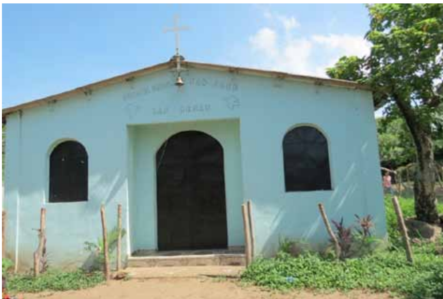
Figura 11. Vista de la fachada de la iglesia católica de la comunidad San José Las Mesas, municipio Puerto de La Libertad.