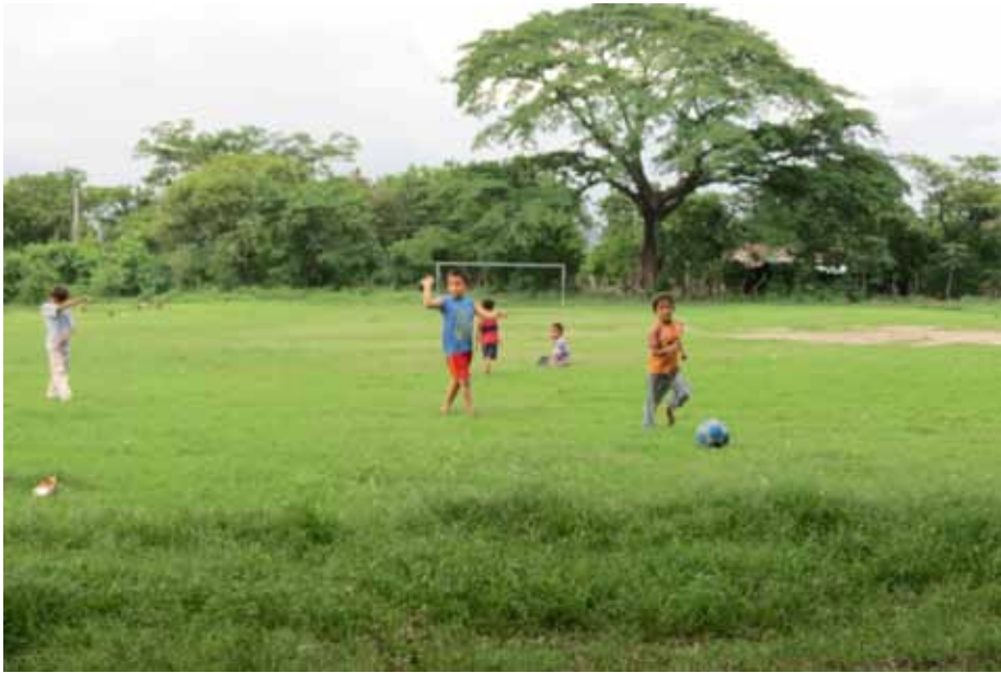
Figura 9. Vista de niños jugando fútbol en la cancha de la comunidad Tlacuxtli.

La señora, que dice ser originaria de Panchimalco, recuerda que sus padres y abuelos iban vestidos en huipiles y descalzos; además, le inculcaron el conocimiento de la medicina tradicional a través de las plantas. Esta misma señora recuerda que antes había “Brujos. Mi abuelo se hacía cuche, coyote y buey; con ello curaba a la gente. A una señora le sacó un muñeca del estomago” . En relación con esto, una de las lugareñas que venía migrando por la diáspora de la guerra de la década de 1980 asegura que le decían: “No pidan agua en cualquier lugar, porque la gente es mala; la gente se hace cuche” . Esto como parte de la memoria a partir del conocimiento que tenían de los lugareños de esta zona de cosmovisión indígena, como se ha visto en Huizúcar, Comasagua y Panchimalco (Erquicia, Herrera y Pleitez, 2013).