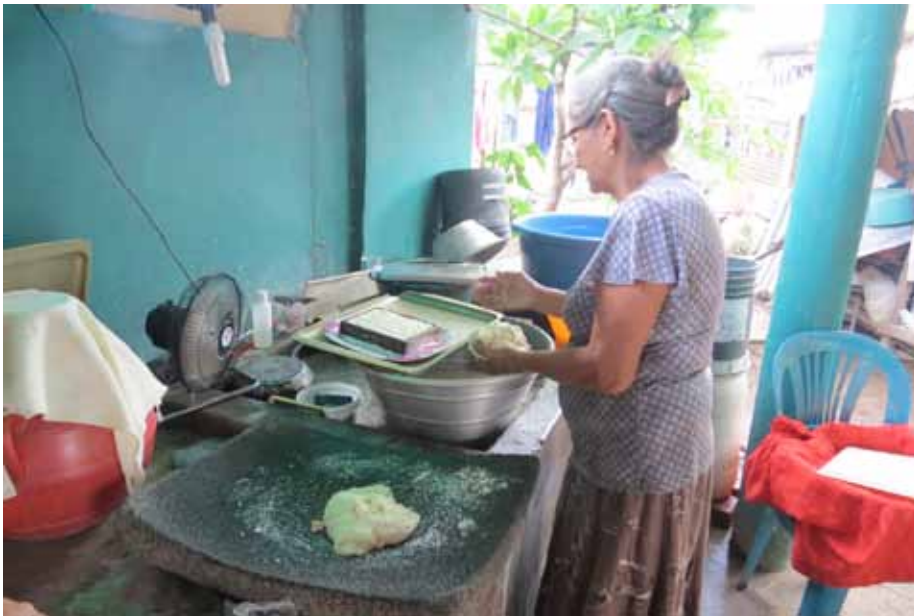
Figura 6. Vista de señora en la elaboración de queso artesanal, conocido como requesón. Cantón hacienda San Diego.

El señor Huevo trabajó toda su vida como agricultor en la hacienda San Diego, incluso cuando dicha propiedad pertenecía al señor Walter Thilo Deininger. Recuerda que en ella se cultivaba caña de azúcar, algodón, maíz, además de la argalia y del pastoreo de ganado. Cuenta que en la actualidad la gente que reside en el cantón hacienda San Diego se dedica a labores agrícolas y de ganadería, además, hay pequeñas tiendas en donde venden productos lácteos como requesón, queso y crema.