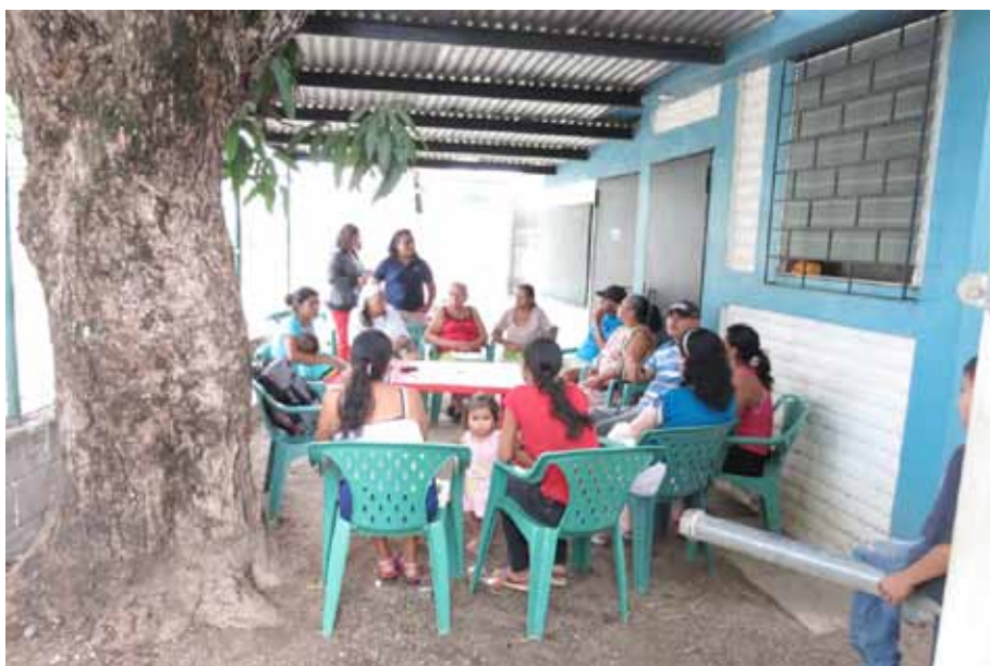
Figura 5. Vista del desarrollo del grupo focal en la comunidad El Coplanar, cantón El Cimarrón, municipio Puerto de La Libertad.

¿Cuál es el oficio o trabajo de la gente de El Coplanar? Ante este interrogante, se expresaban que trabajan en la agricultura de subsistencia, tanto hombres como mujeres. Por su parte las mujeres trabajan en los oficios domésticos de la casa. Cuando hay oportunidad de trabajo, van a lavar ropa a otras casas. Las mujeres estuvieron hace tres años en el Programa de Apoyo Temporal al Ingreso por 6 meses, recolectando basura. Muchos de los hombres que trabajan fuera de la comunidad laboran en fábricas (maquilas) y en la construcción como albañiles. Uno de los hombres tiene el oficio de marroquinería (elaboración de objetos de cuero como cinchos, carteras, billeteras y otros artículos). Otras mujeres tienen pequeñas tiendas de artículos domésticos y venden productos a través de catálogos.