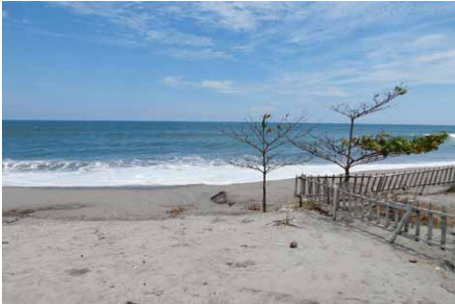
Figura 8. Vista de la playa San Diego desde uno de los hostales turísticos de la zona.

Adicionalmente están las historias relacionadas con la tradición oral de estos lugares: “La cuestión es que hay uno de los cerros (en el) que dicen que, como a las 12 del día, asustan se sienten cosas raras, una brisa rara, una vibración” . Esto es parte del recorrido y de la historia que los guías locales cuentan mientras conducen por algunos lugares de interés de la hacienda y playa San Diego, según el entrevistado.