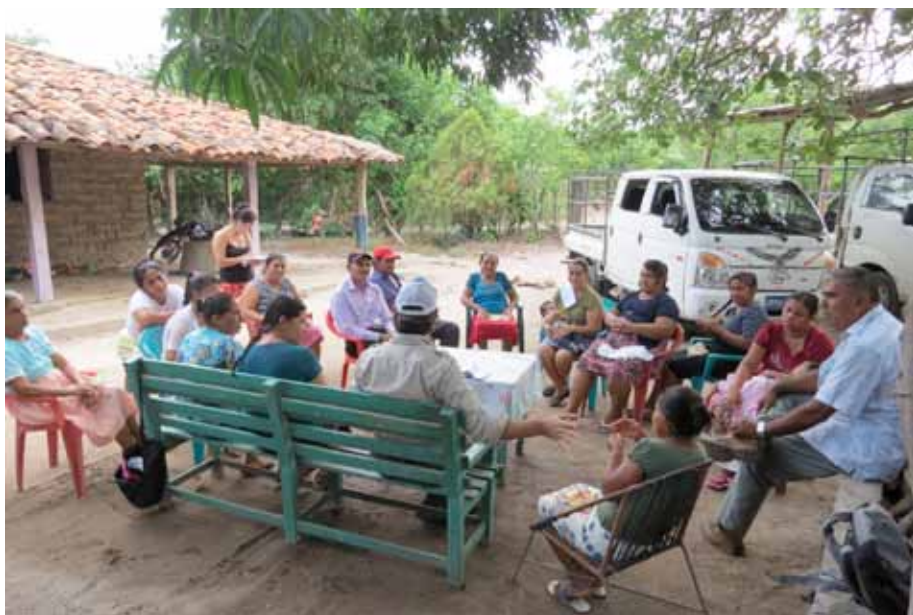
Figura 10. Vista de la realización del grupo focal en la comunidad Tlacuxtli, Cangrejera.