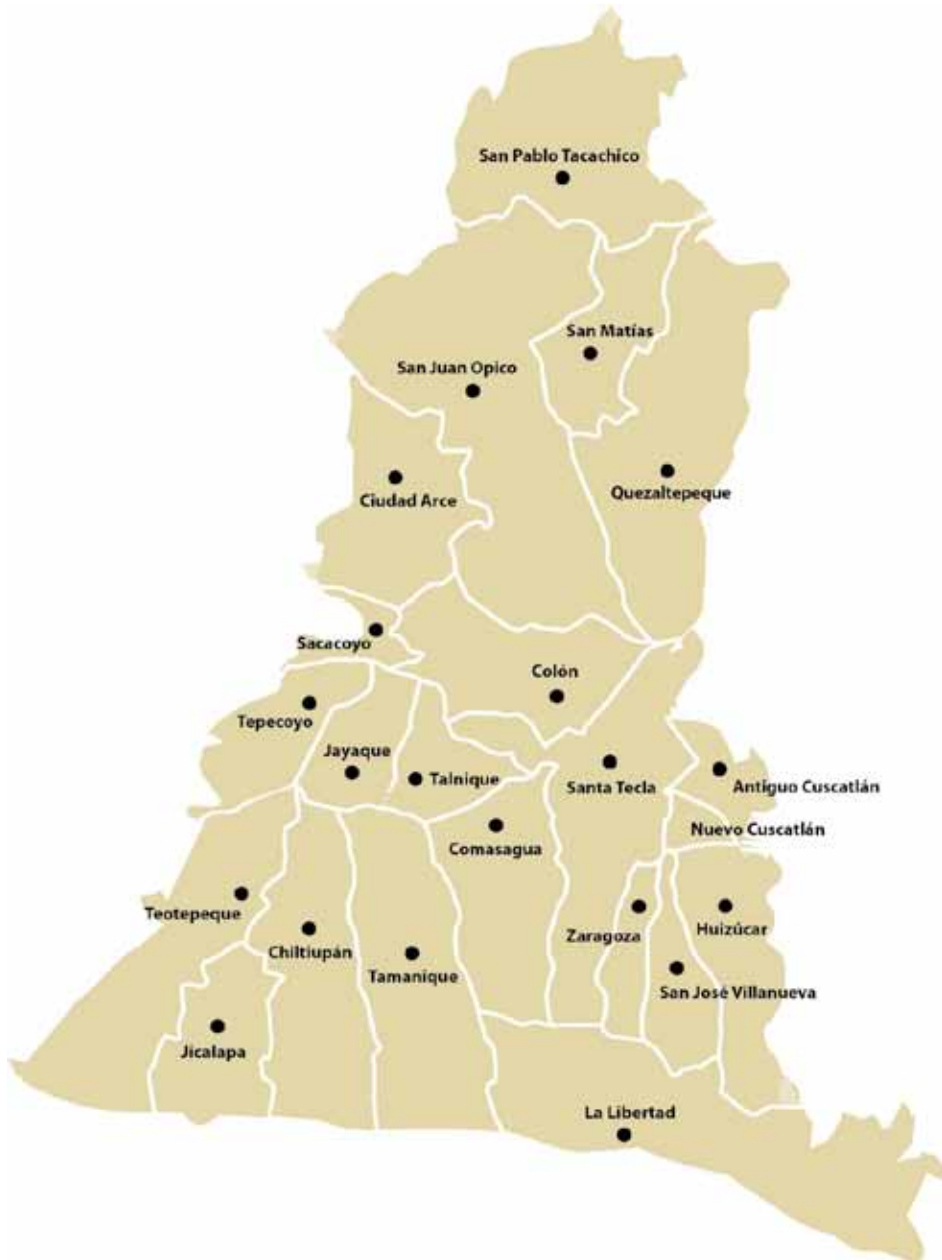
Figura 1. Mapa de municipios del departamento de La Libertad. Al sureste se ubica el municipio Puerto de La Libertad.