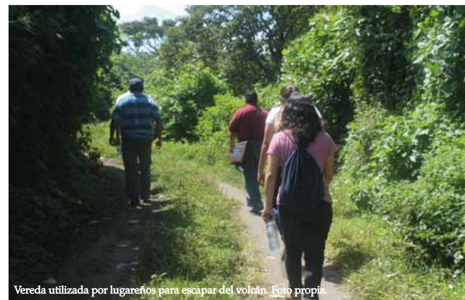
Vereda utilizada por lugareños para escapar del volcán.

Se logró recabar varias tradiciones orales, entre las que se encuentra “el bolo guía”, “la cruz milagrosa”, “el chino quemado”, entre muchas otras que se encuentran en la versión completa del informe de investigación.