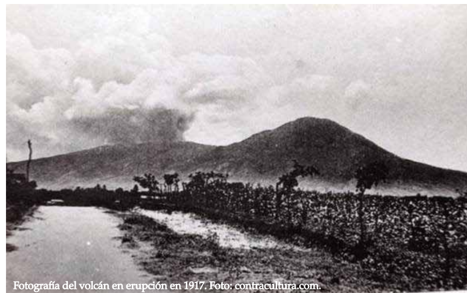
Fotografía del volcán en erupción en 1917.

Esta investigación fue auspiciada por la Universidad Tecnológica de El Salvador con el propósito de contribuir a la celebración de los cien años de la erupción del volcán de San Salvador, que sucedió en 1917. El documento recopila elementos de tradición, historia oral, actividades económicas e información general sobre los habitantes de los municipios y cantones que comparten el volcán de San Salvador. Se trató de un estudio de carácter monográfico, con aplicación de técnicas etnográficas, como la observación participante y la entrevista semiestructurada, así como de la revisión de fuentes documentales, tanto escritas como fotográficas. El estudio se llevó a cabo durante los meses de febrero a diciembre del año 2016, en los municipios de San Salvador, Santa Tecla, Quezaltepeque, Nejapa y San Juan Opico. Como principales resultados se logró compilar leyendas y tradiciones orales propias de los habitantes de los cantones aledaños al volcán, se identificó y sistematizó la práctica de creación de carbón vegetal como parte de los procesos económicos locales y se registraron testimonios de diferentes autores sobre la erupción del volcán.