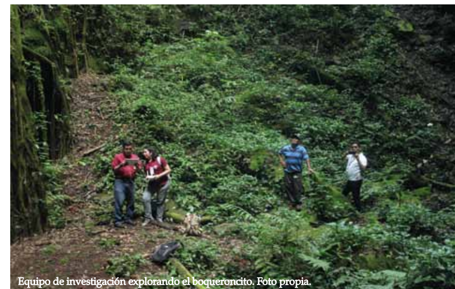
Equipo de investigación explorando el boqueroncito.

huyeron de la erupción que ahora viven en áreas como San Martín, Apopa y Ciudad Delgado, entre otras.