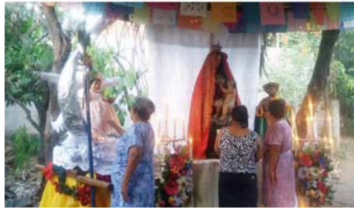
Figura 4. Elaboración de tamales en la cofradía Las Mariitas. Fotografía tomada por Georgina Ordóñez, 2018.

creencias y las prácticas de sus familiares, lo que amenaza la función y existencia de las cofradías.