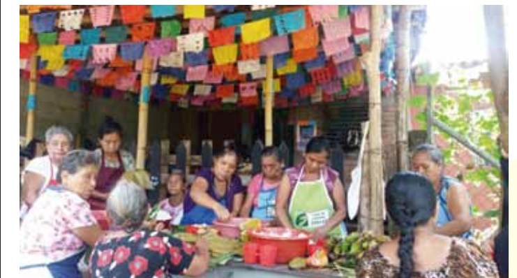
Figura 3. Elaboración de tamales en la cofradía Las Maritimas. Fotografía tomada por Georgina Ordoñez, 2018.

Por otra parte, las cofradías fortalecen los vínculos sociales de sus colaboradores debido a los momentos que comparten durante toda la celebración. Cuando se realizaba la fiesta, se identificaron dos momentos fundamentales que dan paso al fortalecimiento de las relaciones sociales. Por una parte, la tamaleada , tiempo en el cual el grupo de comadres se reúne para preparar los tamales y también para contar chistes, historias y experiencias e incluso para desahogar sus penas con las personas en quienes confían. Horas más tarde, las comadres se reúnen para bailar sus piezas favoritas, al compás de la música de la marimba. Bailan entre ellas, con las personas que les generan confianza, fortaleciendo el vínculo del compadrazgo. Es normal que cuando bailan el trago se haga presente, motivándolas a bailar con más energías. Cabe señalar que también los hombres participan del baile, pero menos que las mujeres.