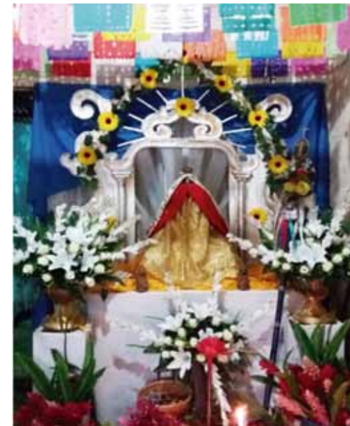
Figura 1. Mesa altar de la Virgen de las Maritimas.

Según la percepción de los participantes de la investigación, en la organización de una cofradía se observan costumbres ancestrales que sobreviven en la actualidad gracias a su transmisión de generación en generación. Las entradas, los atributos, la música de marimba, la decoración, los rituales, entre otros, forman parte de las costumbres que perviven en las cofradías de la actualidad, impulsadas por el deseo de los mayordomos de replicar el actuar de sus antepasados; y además existen como evidencia de los pueblos originarios de El Salvador.