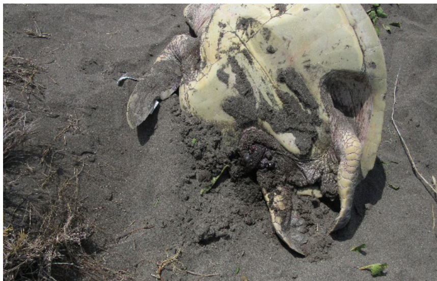
Figuras 24 y 25. Tortuga asesinada para extraerle los huevos