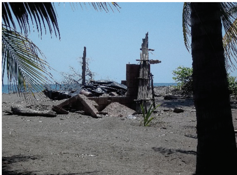
Figuras 20 y 21. Casas destruidas en mayo de 2015