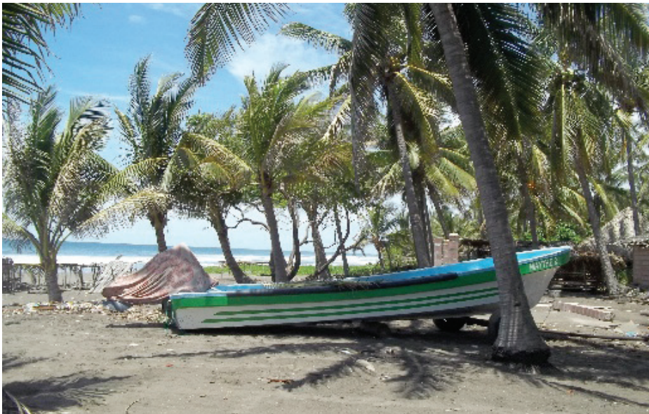
Figuras 8 y 9. Implementos de pesca

Hay varias familias que reciben remesas de sus familiares que residen principalmente en los Estados Unidos y unos pocos en Italia.