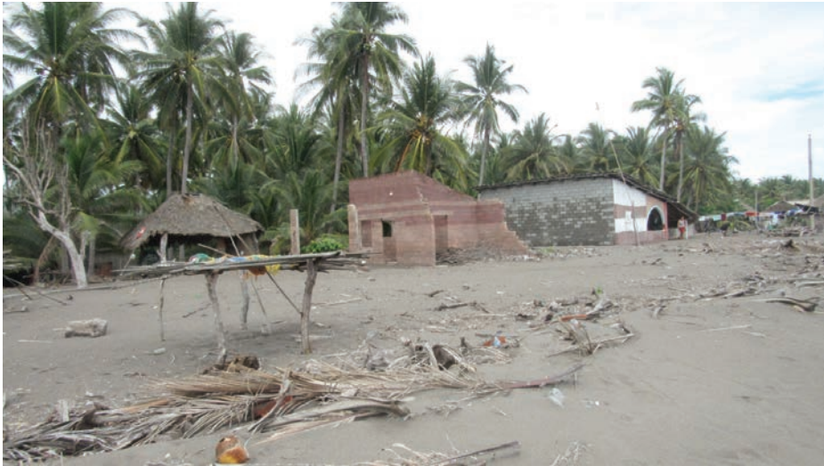
Casa destruida en mayo 2015 por el fenómeno de mar de fondo.