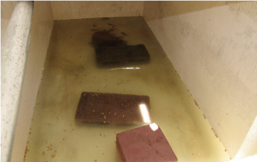
Figuras 26 y 27. Crianza doméstica de pululos