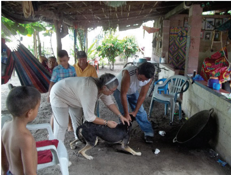
Figuras 15 y 16. Desparasitando mascota