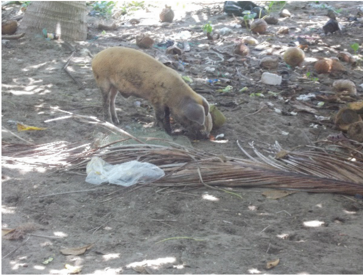
Figuras 18 y 19. Crianza doméstica de cerdos