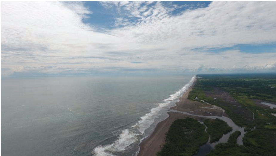
Figura 6. Vista aérea del manglar de El Botoncillo y El Tamarindo