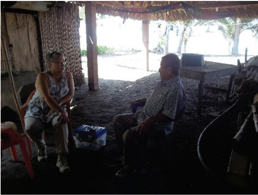
Figuras 2 y 3. Entrevistados