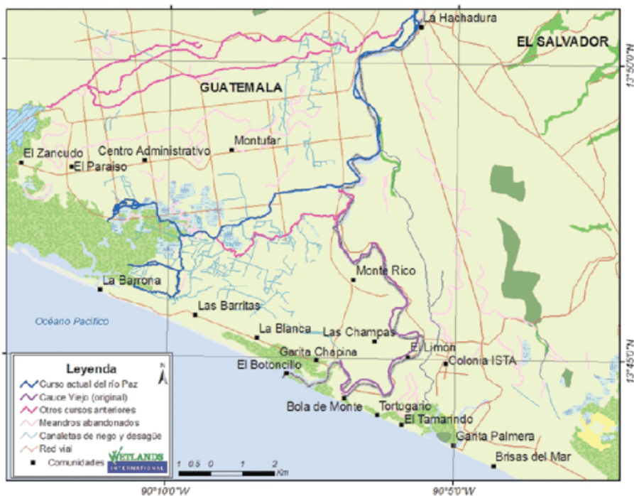
Figura 5. Mapa del Ramsar, Complejo Barra de Santiago

El mapa de ubicación de los dos caseríos en estudio más ilustrativo encontrado después de la búsqueda bibliográfica es el siguiente.