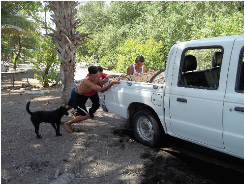
Figuras 22 y 23. El vehículo de la Utec se embancó en la arena