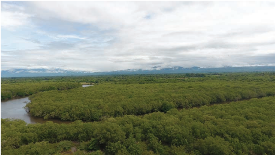
Figura 7. Vista aérea del manglar en buen estado